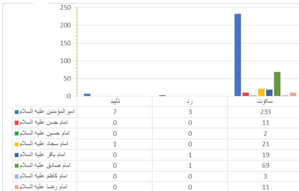
نمودار شماره ۲: نحوه موضعگیری ثعلبی در برابر روایات اهل بیت (ع)